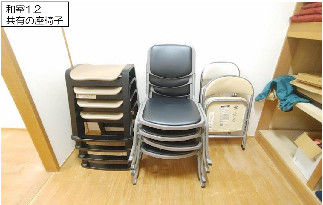
和室1.2 共有の座椅子