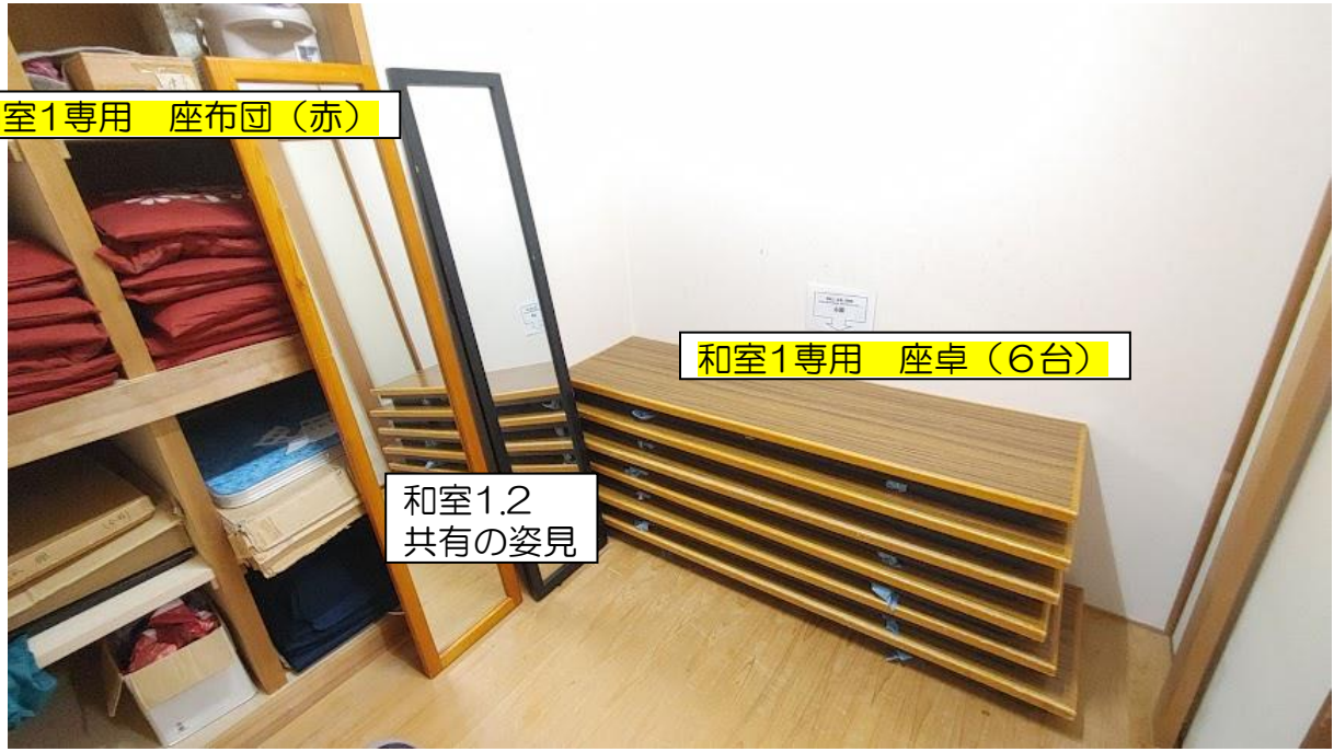
和室1専用 座卓 (6台)